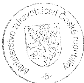
Leoš Heger ministr zdravotnictví

Tato zřizovací listina nabývá platnosti a účinnosti dnem vydání. Dodatky ke zřizovací listině se číslují pořadovými čísly a jsou její nedílnou součástí.