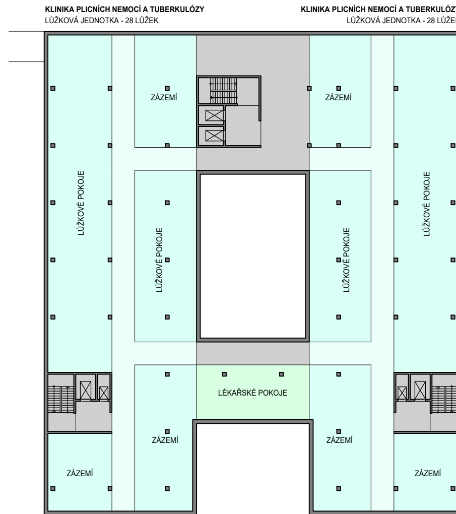
KLINIKA PLICNÍCH NEMOCÍ A TUBERKULÓZY LŮŽKOVÁ JEDNOTKA - 28 LŮŽEK