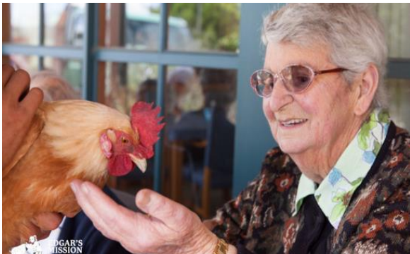
Obrázek 4 terapie se slepicí