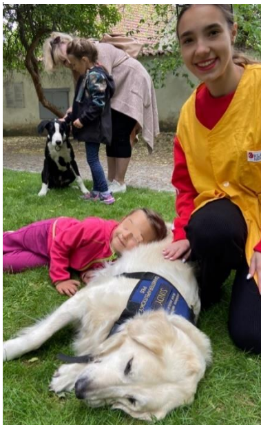
Obrázek 11 Polohování