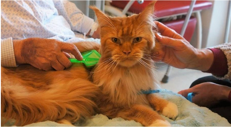
Obrázek 1 Terapie s kočkou