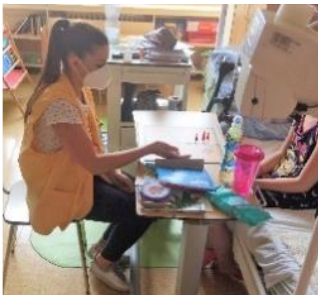
Obrázek 18 Práce dobrovolníka