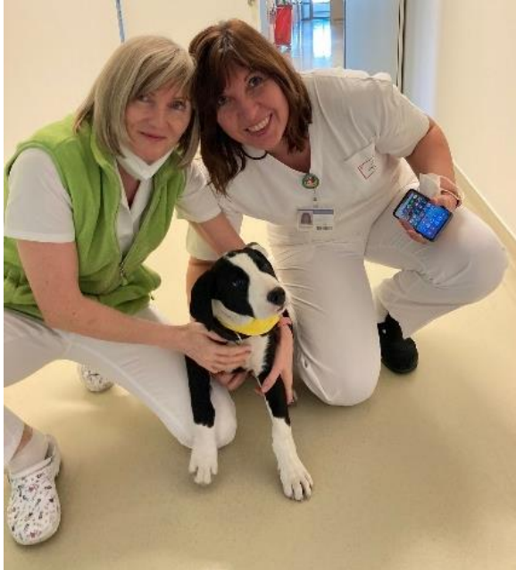
Obrázek 8 Štěně