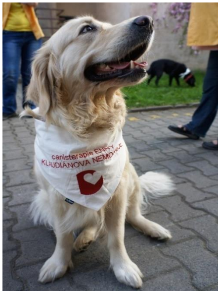
Obrázek 15 Označení psa

Canisterapeutický pes musí být označen.