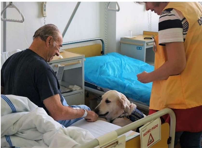
Práce canisterapeutického týmu na oddělení následné péče Oblastní nemocnice Mladá Boleslav.