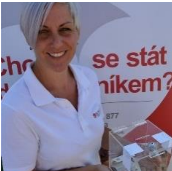
Obrázek 28 Veřejná sbírka

Na projekt dobrovolnictví, na podporu canisterapie, je nově možno přispět. Zdroj: www.klaudianovanemocnice.cz