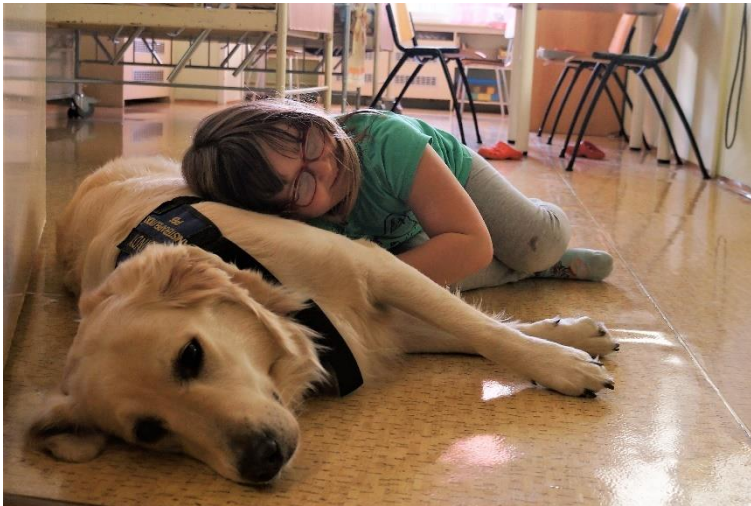
Obrázek 12 Polohování

Polohování je velmi efektivní technikou. Snímek je pořízen na dětském oddělení nemocnice.