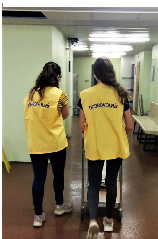
Obrázek 23 Ukázka dobrovolnické vesty