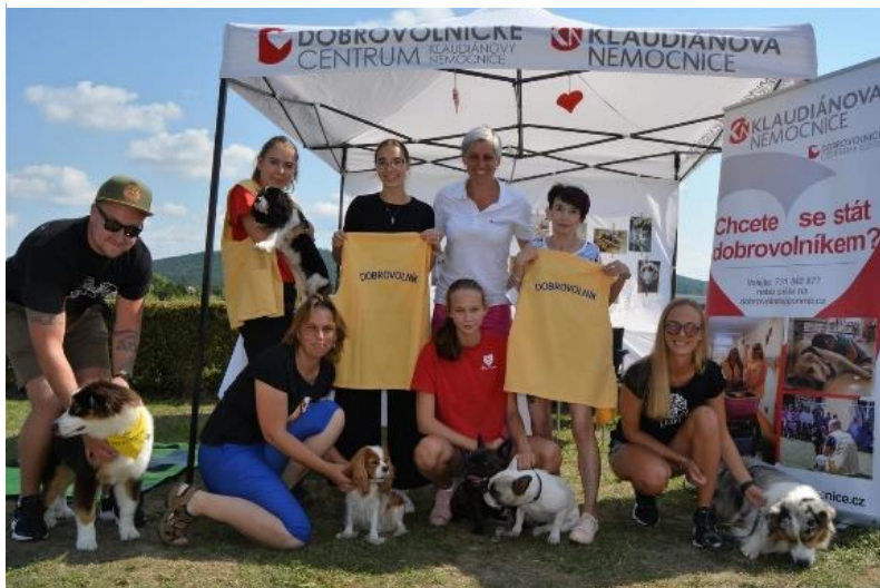
Obrázek 13 Dobrovolnický program

Dobrovolnické centrum Klaudiánovy nemocnice má dnes dobře fungující canisterapeutický program.