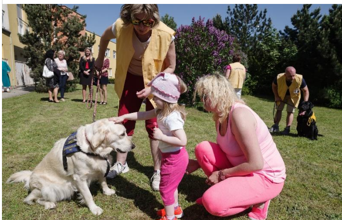
Obrázek 6 Uživatel canisterapie