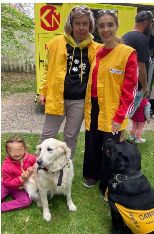
Obrázek 22 Označení dobrovolníka

Nezbytnou povinností je dodržování osobní hygieny a nošení žluté vesty s nápisem „dobrovolník“. Nadále se řídí požadavky a instrukcemi sestry, která ten den má službu. Respektuje, že se neptá na zdravotní stav klienta, nemluví o jeho zdravotní situaci a zachovává mlčenlivost. Po dobrovolnické činnosti vždy zapíše docházku do sešitu na