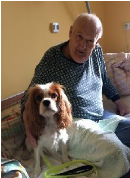
Obrázek 14 Canisterapie

Návštěva psa je seniory vždy vítána.