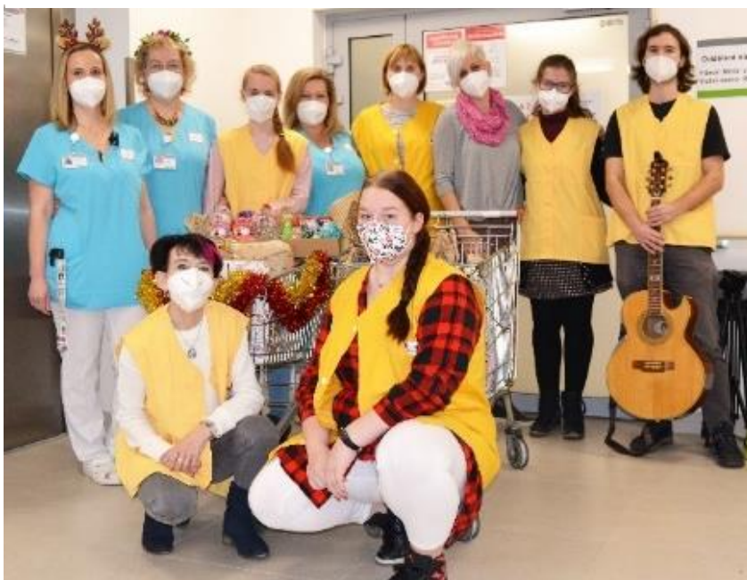
Oblastní nemocnice Mladá Boleslav má dnes stabilní tým dobrovolníků, kteří se aktivně zapojují do jednorázových i dlouhodobých programů Dobrovolnického centra.

Dobrovolníkem je každá osoba starší patnácti let se souhlasem zákonného zástupce nebo starší osmnácti let. Činnost vykonává ze své dobré vůle s ochotou pomáhat, poskytovat své znalosti a dovednosti dál. Vykonává činnost ve svém volném čase bez nároku na finanční odměnu. Dobrovolník se na rozdíl od