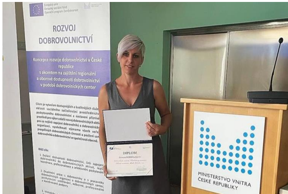
Obrázek 26 Ocenění